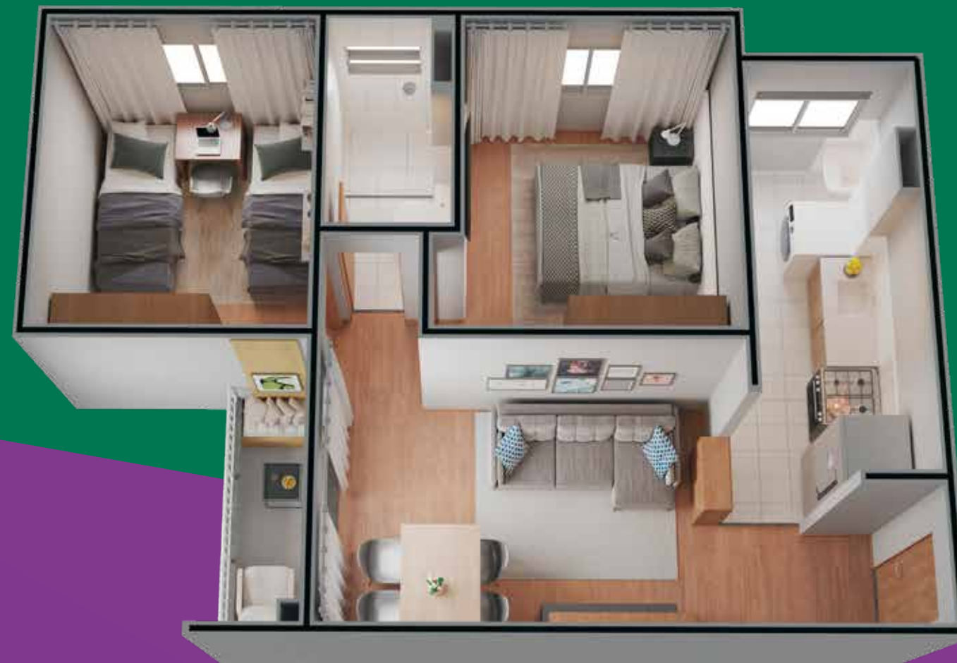
Referência: Apartamento 201 - Torre 2

Aconchegue-se no conforto de cada cantinho do seu lar.