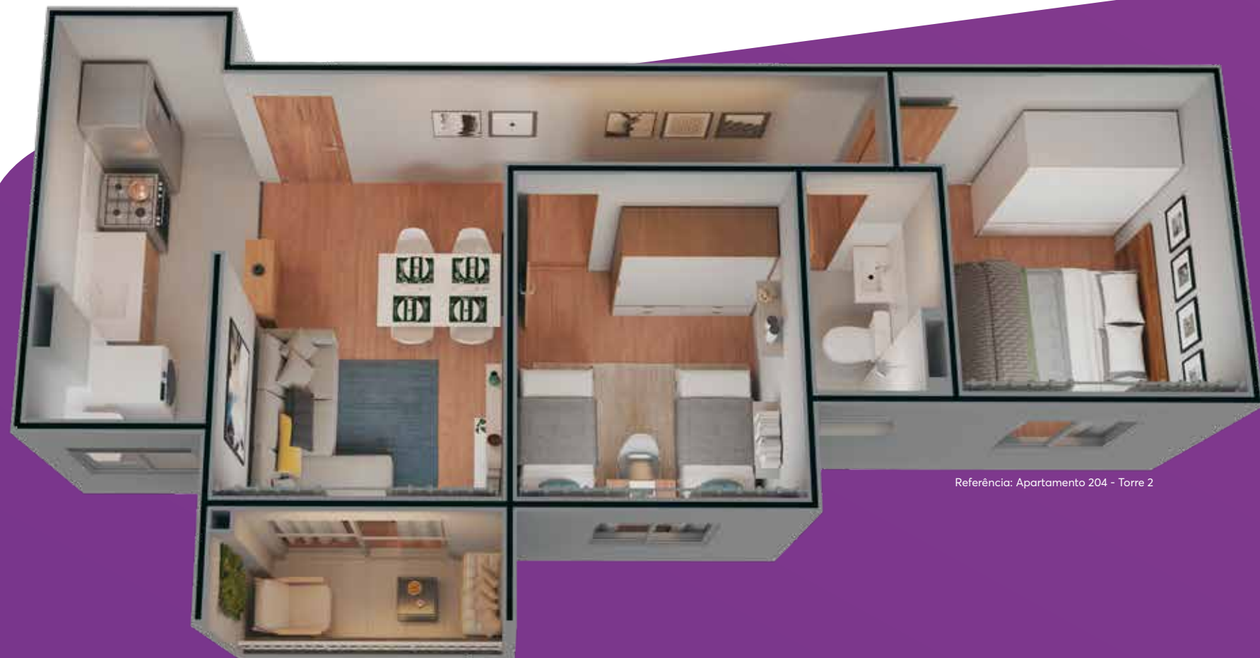
Referência: Apartamento 204 - Torre 2

Aconchegue-se no conforto de cada cantinho do seu lar.