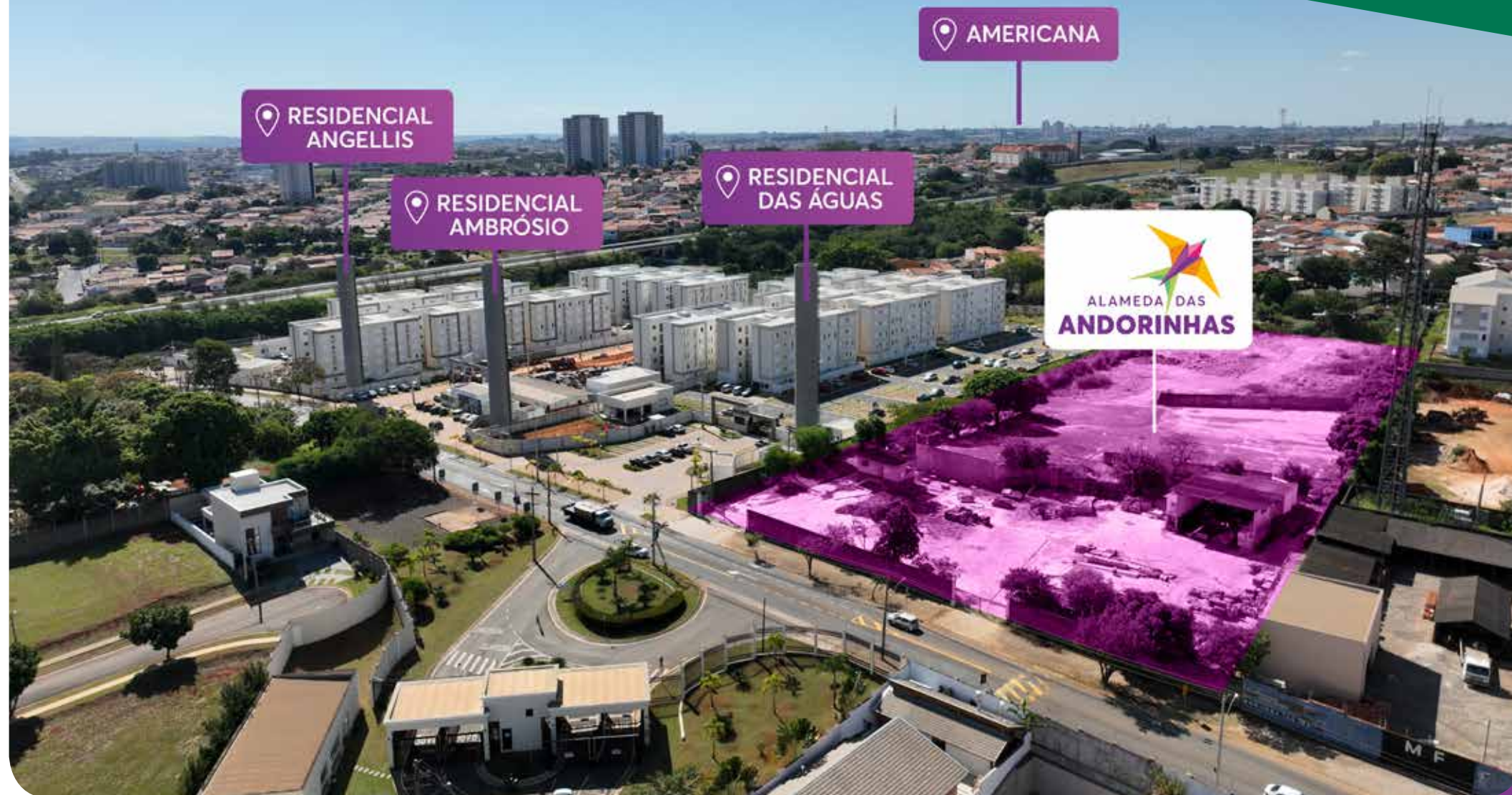
Foto aérea do local

É sua vida com tudo que você gosta, por perto.